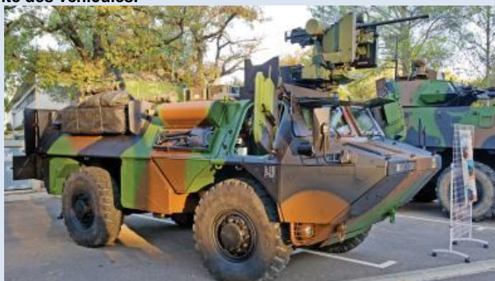
Le VAB Ultima

La protection des militaires contre les engins explosifs improvisés (IED), responsables de la majorité des pertes humaines lors de l'opération, est rapidement devenue une priorité. Tout au long de Barkhane, le niveau de blindage des véhicules a ainsi été augmenté. Avant l'arrivée des véhicules de l'avant blindé (VAB) ultimas, les véhicules blindés légers (VBL) ont été dotés de kits anti-mines et les porteurs polyvalents logistiques ont été blindés. Parallèlement, des systèmes de brouillage ont été installés et des équipements de lutte anti-drones expérimentés. Aujourd'hui, les armées disposent d'un parc d'environ 400 brouilleurs, dont plus des deux tiers étaient déployés au Mali. Ces systèmes seront progressivement remplacés par le dispositif « Barage », développé par Thales : une demi-douzaine étaient déployés en bande sahélo-saharienne, essentiellement au sein des troupes du génie, chargées d'ouvrir les itinéraires. Toutefois, les brouilleurs ne sont efficaces que contre les IED déclenchés à distance alors que la majorité sont déclenchés par pression, au passage du véhicule. S'il s'est ainsi avéré impossible d'obtenir un véhicule protégé à 100%, l'opération a permis de créer un processus d'aller-retour efficace avec les industriels pour améliorer la sécurité des véhicules.