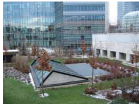
Issy-les-Moulineaux, un incinérateur au cœur de la ville