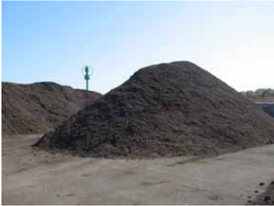
Syndicat Centre Hérault, un compost labellisé bio