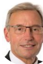
René-Paul Savary Sénateur (LR) de la Marne Rapporteur pour avis