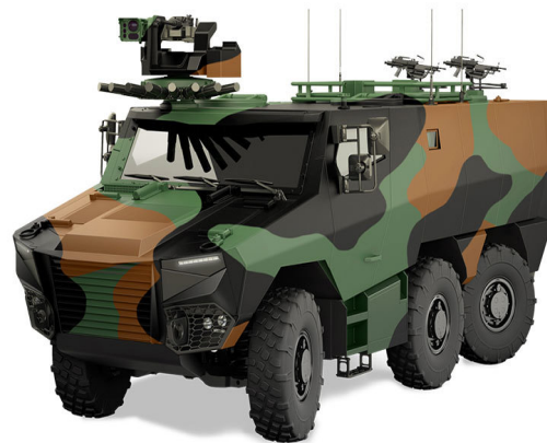
Véhicule blindé multi-rôle Griffon

La LPM ne permet de réaliser que 50 % du programme Scorpion , soit 936 Griffon (sur une cible de 1818), 150 Jaguar (cible de 300), 122 chars Leclerc rénovés (sur 200). 271 Griffon, ont été récemment commandés (2020), ce qui porte le total des commandes à 610. Une partie importante de l'objectif 2025 reste à contractualiser ; en outre, une autre partie du programme ne sera réalisée qu'au-delà de 2025. La deuxième étape du programme Scorpion est incontournable car elle doit permettre d'en tirer le plein potentiel.