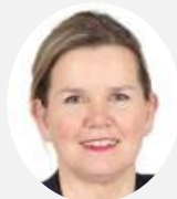
Marta de Cidrac

Président Sénateur du Doubs (Union centriste)