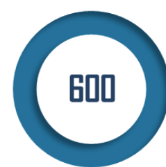
Nombre de bénéficiaires épuisant leur crédit d'AJPP

Toutefois, à l'issue de cette période de trois ans, la plupart des enfants sont généralement soit guéris, soit, malheureusement, décédés, ce qui rend sans effet la possibilité existante de renouvellement. Ces dispositions ne répondent donc pas aux besoins des quelque 600 foyers 3 (soit 6 % des bénéficiaires) qui, au cours de la période de trois ans, épuisent leur « crédit » de 310 jours d'AJPP. Dans le cas de cancers pédiatriques, les chiffres les plus pessimistes évaluent à 30 % la part des parents bénéficiaires de l'AJPP qui auraient besoin d'une prolongation du nombre de jours d'allocation.