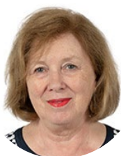
Catherine Deroche Sénatrice (LR) de Maine-et-Loire Présidente

Enfin, les conséquences concrètes de mise en œuvre de cette proposition de loi devront être attentivement suivies. Selon la commission, la question de la suppression du plafonnement de l'AJPP reste ouverte dès lors que la prise en charge de certaines pathologies, comme les leucémies ou les tumeurs cérébrales, peuvent justifier un accompagnement parental dépassant les 620 jours.