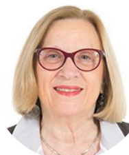
Colette Mélot Sénatrice (LI) de la Seine-et-Marne Rapporteuse

http://www.senat.fr/dossier-legislatif/pp120-157.html