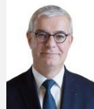
Hervé Maurey Président de la commission Sénateur (Union Centriste) de l'Eure