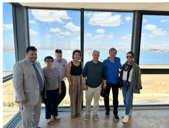
Parlementaires français et marocains devant les panneaux de la centrale (unité 3)

La visite de la centrale solaire de Noor a permis de mesurer l'engagement du Maroc en faveur des énergies renouvelables. Inauguré en 2016, ce parc solaire délivre une production de 582 MW par an, grâce à quatre unités, chacune basée sur une technologie différente. Le Maroc, dont le mix énergétique est déjà composé à 42% d'énergies renouvelables, a pour objectif de porter ce taux à 52% à l'horizon 2030.