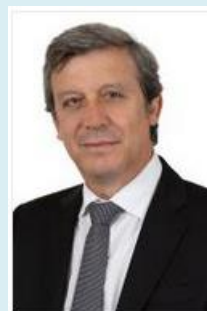
M. David ASSOULINE

Vice-présidente du groupe d'amitié Sénateur des Alpes- Maritimes (LR)