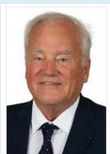
M. Christian CAMBON

Président du groupe d'amitié Président de la commission des affaires étrangères, de la défense et des forces armées Sénateur du Val-de-Marne (LR)