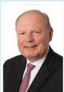
M. Hervé MARSEILLE

Président du groupe d'amitié Président de la commission des affaires étrangères, de la défense et des forces armées Sénateur du Val-de-Marne (LR)