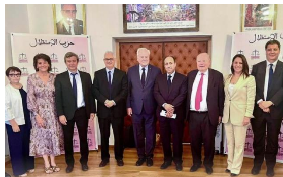
Parlementaires français et marocains autour de M. Nizar Baraka (4 ème à partir de la gauche)

La rencontre a permis d'évoquer les nombreux investissements du Maroc en matière d'équipement, sur le territoire du royaume ainsi que dans les pays africains avec lesquels sont noués des partenariats. L'objectif poursuivi est de permettre au continent de mieux intégrer les chaînes de valeur mondiales, en disposant des infrastructures nécessaires, et de contribuer ainsi à l'industrialisation et au